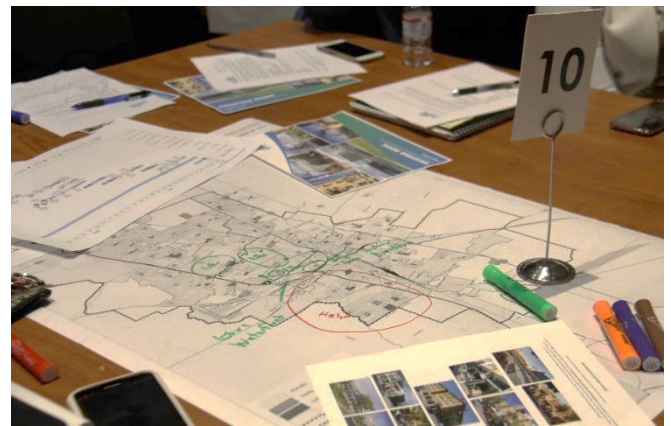
Materiales del taller comunitario

3. Guía para embajadores de la comunidad. La guía de embajadores de la Comunidad es un material que los líderes de la comunidad pueden utilizar para informar a los miembros de la comunidad sobre el Plan General de Sonoma a través de sus redes establecidas. La guía incluirá una carta de invitación para el equipo del Plan General a utilizar para construir la red de embajadores, folletos educativos, y una presentación de PowerPoint que se puede personalizar para los embajadores individuales.