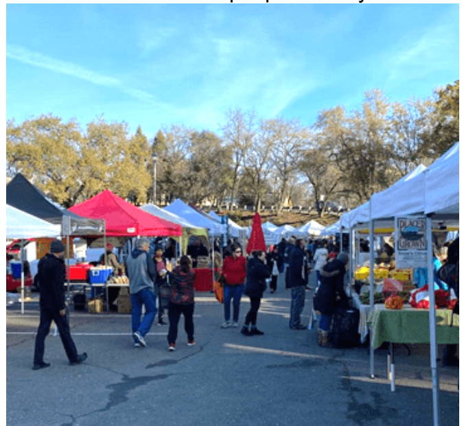
Participación en los mercados agrícolas

El equipo del Plan General facilitará las discusiones de grupos de discusión, algunos de los cuales implicarán a múltiples comunidades desatendidas. Los grupos de discusión pasarán en lugares que sean convenientes para cada comunidad y estarán en inglés y español. Como el proceso del Plan General utilizará la Oficina del Condado de Sonoma de herramientas de participación equidad, tenemos la intención de mantener el contexto breve, ser intencional acerca de los roles de facilitación y el espacio que se utiliza para los grupos de enfoque, permanecer a la duración de las reuniones de 90 minutos o menos, e incluyen no más de 15 participantes y no menos de 4 participantes. El plan de herramientas para la participación de la Oficina de Equidad del Condado de Sonoma también recomienda una compensación equitativa para los participantes.