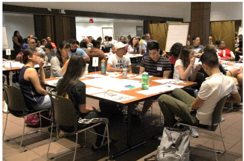
Taller en una universidad local

Eventos que no cumplen las normas de la Ley para Personas con Discapacidades (ADA) (por ejemplo, inaccesibles para personas en silla de ruedas, con discapacidades auditivas o visuales, o con otras formas de discapacidad) constituye una barrera física para la participación. Además, los lugares a los que sólo se puede acceder en vehículo personal dificultan o impiden la