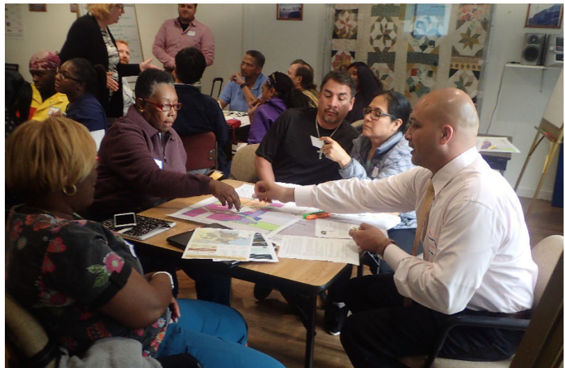
Ejercicio en pequeños grupos en un taller comunitario

pequeños grupos. Se servirán comidas para apoyar la inclusión y reconocer el valor de la experiencia y el tiempo de los miembros de la comunidad. El equipo del Plan General también dará materiales para una actividad con niños. Además, el equipo del Plan General