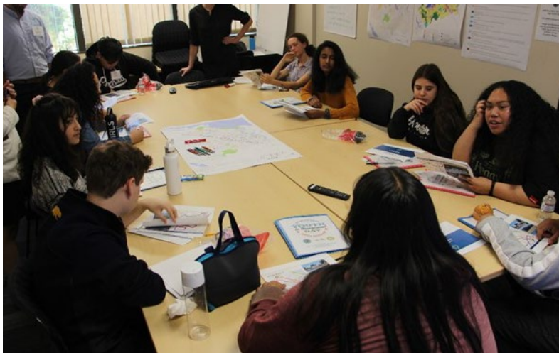
Evento del Plan General con la juventud en una escuela secundaria

El Plan General 2020 del Condado de Sonoma fue adoptado por la Junta de Supervisores en 2008. Desde su adopción, han ocurrido cambios significativos en el condado, incluyendo condiciones cambiantes relacionadas con la salud pública, el cambio climático, la equidad, el coste del terreno y el precio de la vivienda. Mientras tanto, las leyes estatales sobre lo que debe contemplar el Plan General también han cambiado. La Fase de Visión Comunitaria del Plan General de Sonoma establecerá un enfoque para renovar el Plan General con el fin de responder a estos cambios basándose en una importante colaboración con la comunidad y en una cuidadosa revisión del Plan General actual.