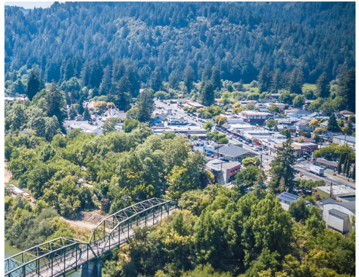
Centro de Guerneville